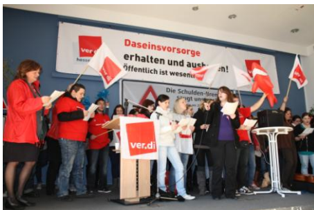
Warnstreik in Frankfurt a. M.

Wir stehen gemeinsam für die Durchsetzung unserer berechtigten Forderungen in der Tarifbewegung 2011.