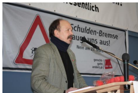
Warnstreik in Frankfurt a. M.