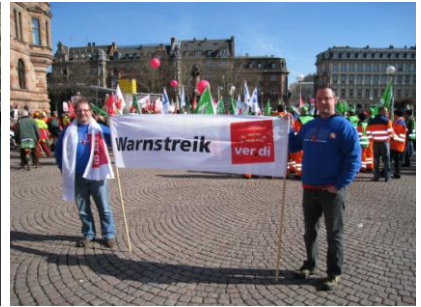
Warnstreik in Wiesbaden