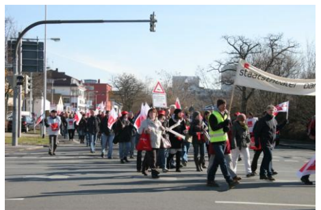
Warnstreik in Darmstadt