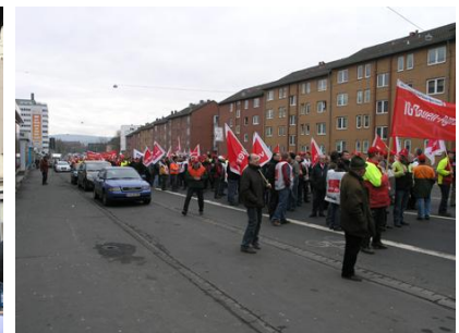
Warnstreik in Kassel